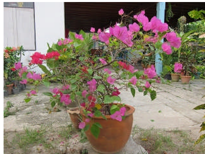
つつじ、いや、ブーゲンビリアです。