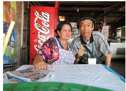
昼ごはんを出してくれるおばさんの店