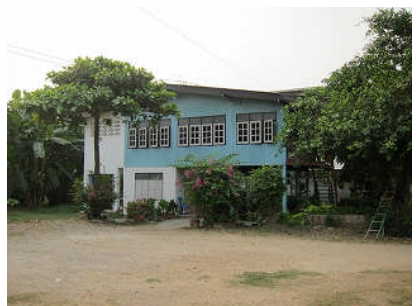
ボランティアの宿舎

バリプログラムのコンセプトは「ボランティア」と文化体験です。バリならではのいろんな体験をしましょう。