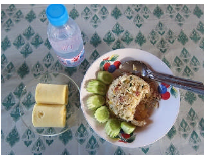
学校の寮の朝ごはん