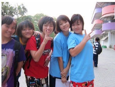
大きな女の子たちの寮