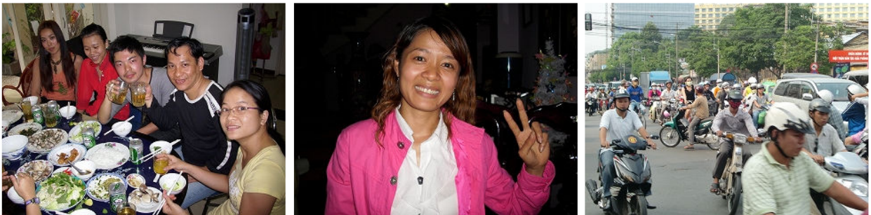
コーディネーターの家でパーティ