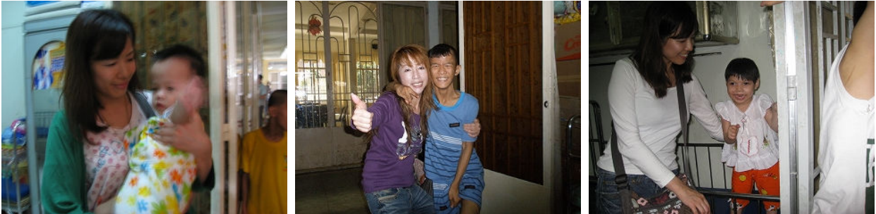
孤児院の子供はその80%が障害をもっています。アメリカとの戦争の後遺症だと説明されました・・・

・ 健康だけど知的障害の子は 覚えてくれ走って来て抱きついてきてくれます。 従って 時間があれば ずっと遊びたいです。一緒に折り紙をしたり 廊下でちょっとふざけたり、私たちは だいたい 1 時間半ほど孤児院に滞在し各部屋を回っていました。