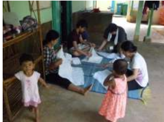
マザーハウス孤児院で洗濯物のお手伝い