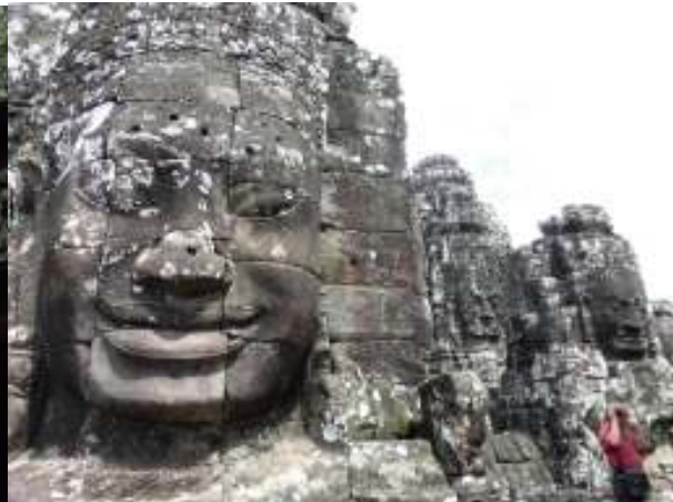
アンコールワットに続き是非とも訪れていただきたい遺跡、タプロームとアンコールトム。