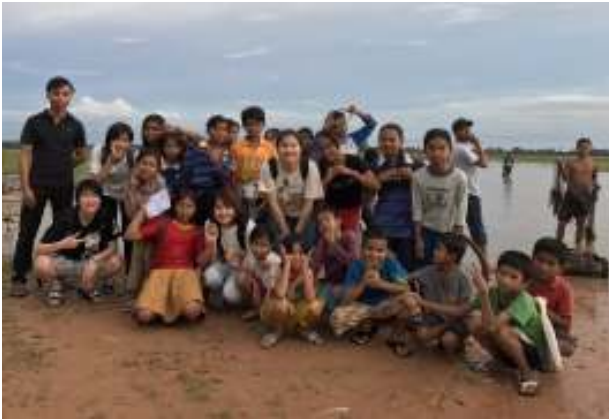
青空教室近くの湖にて