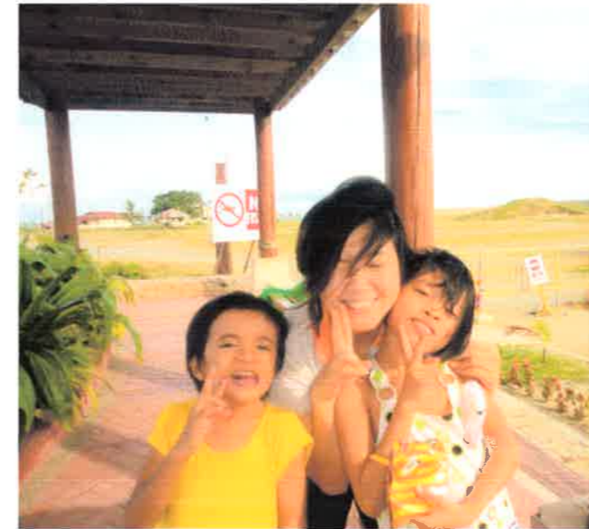
←孤児院のみんなで 近くの海辺にピクニック↓

いただいた写真は今後参加される皆さんの為に利用させていただきます。さしつかえない範囲で結構ですので、現地の人たちとの交流している場面などいただけましたら助かります。よろしくお願いいたします。（お写真は貼り付けず同封でも結構です。）