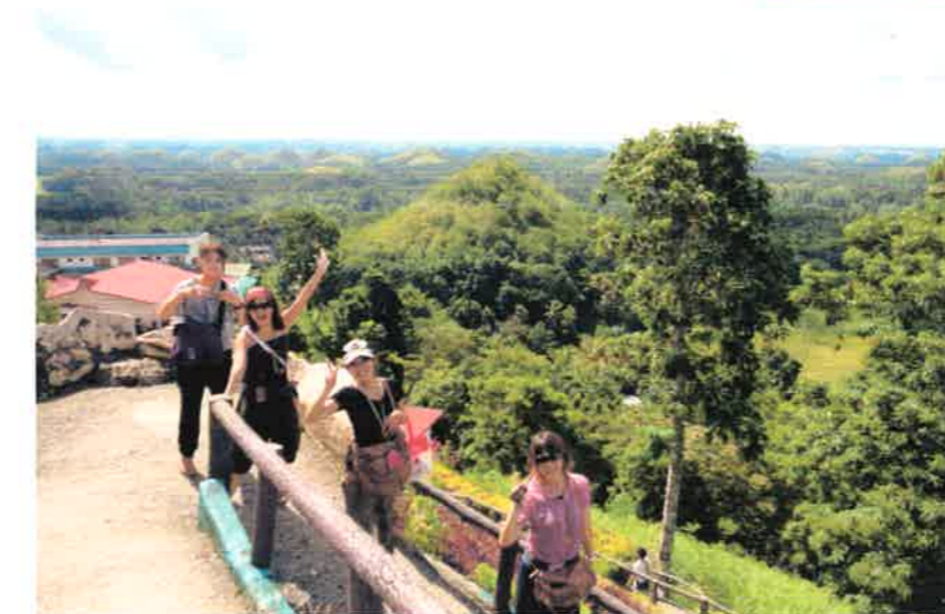
←ボホール島観光 @チョコレートヒルズ